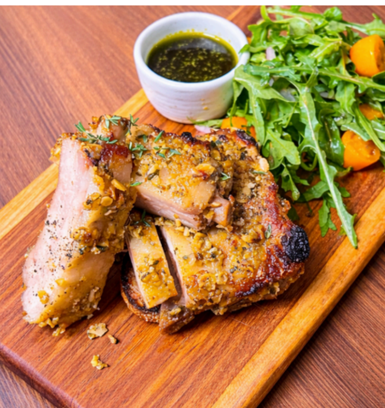
ซีโร่งหมูโตจิบูตะ ตุ่น 15 ชั่วโมง