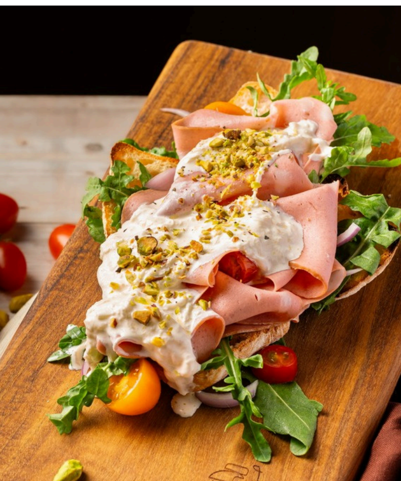
มอร์ตาเดลา เอ บุร์ราตา