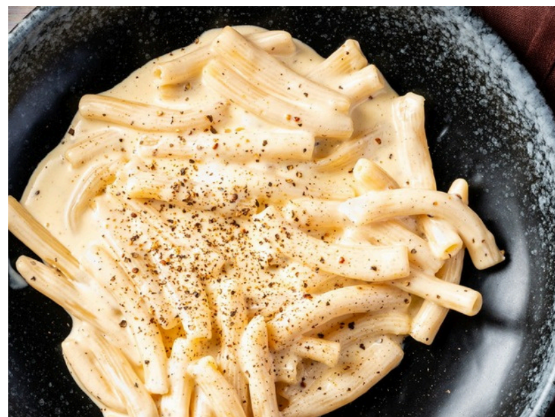
ริกาโตนี คาซิโอ เอ เปเป่