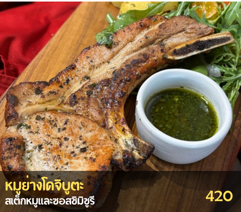
หมูย่างโตจิบูตะ สเต็กหมูและซอสซิมิซูริ