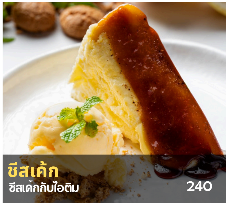
ชีสเค้ก 240 ชีสเค้กกับไอติม