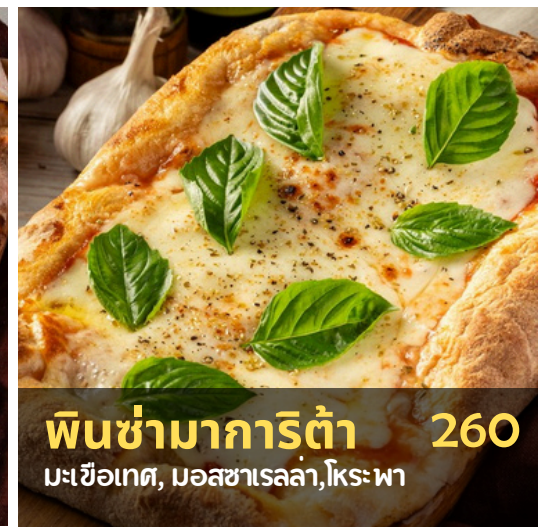
พินซ่ามาการ์ิตา 260 มะเขือเทศ, มอสซาเรลลา, โทระพา