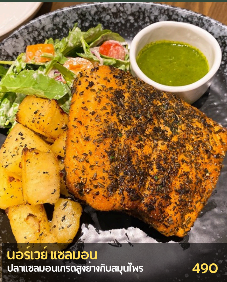
นอร์เวย์ แซลมอน ปลาแซลมอนเกรดสูงย่างกับสมุนไพร 490