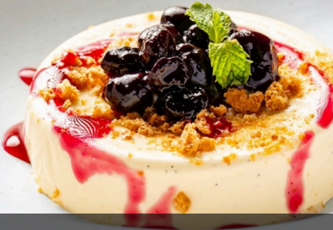
พานาคอตตา 190 ครีมสดพานาคอตต้าผสมเบอร์รี่