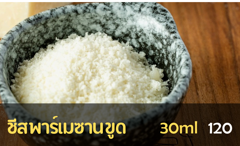
ชีสพาร์เมซานขูด 30ml 120