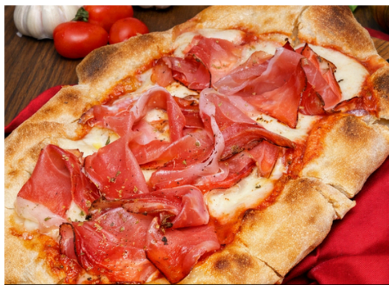
พินซ่ามาสคาร์โปเน่และสเป็ค 490 ลูตเตินตำรับ มาสดาโปเน่, สเป็ค