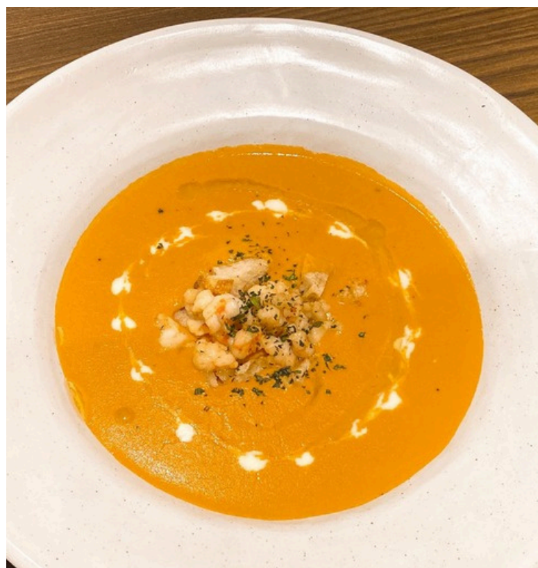
ซูปข้นล็อบสเตอร์ ซูปครีมกึ่งล็อบสเตอร์ออสเตรเลีย 390