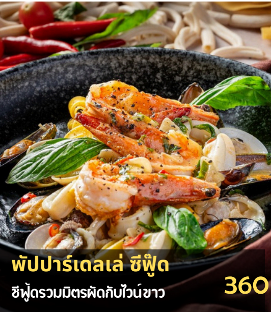
พัปปาร์เดลเล่ ชิฟูด