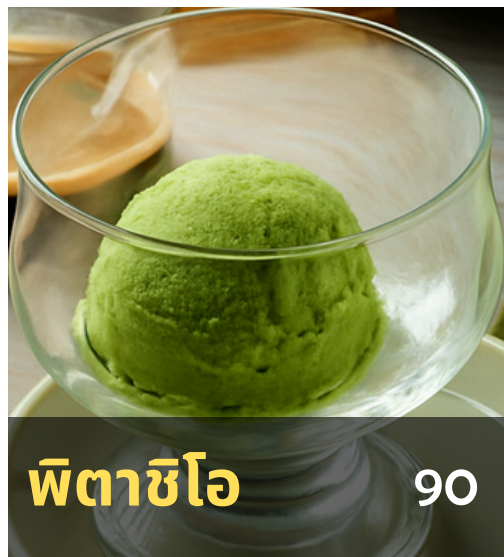
พิตาชิโอ 90