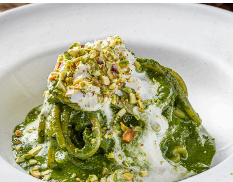
บีโกลี เพสโต่ อี บูราตา