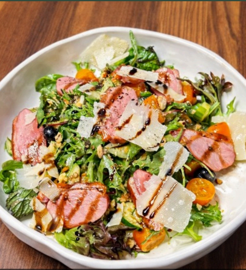
สลัดอบเปิดรมครัว