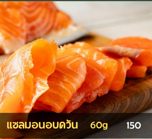
แซลมอนอบควัน 60g 150