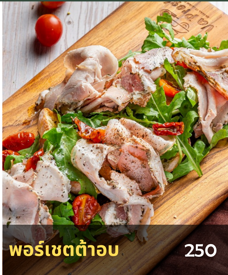
พอร์เซตต้าอบ