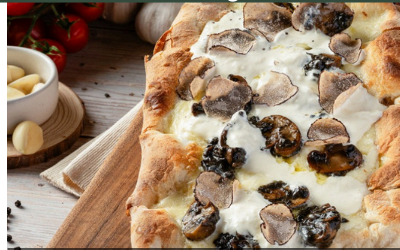
พินซ่าทรัฟเฟิล 520 มอสซาเรลลา เห็ด ทรัฟเฟิลสดหั่นบาง ชีสบูราตา