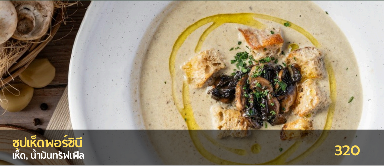
ซปเห็ดพอร์ซัน เห็ด, น้ำมันทรัฟเฟิล