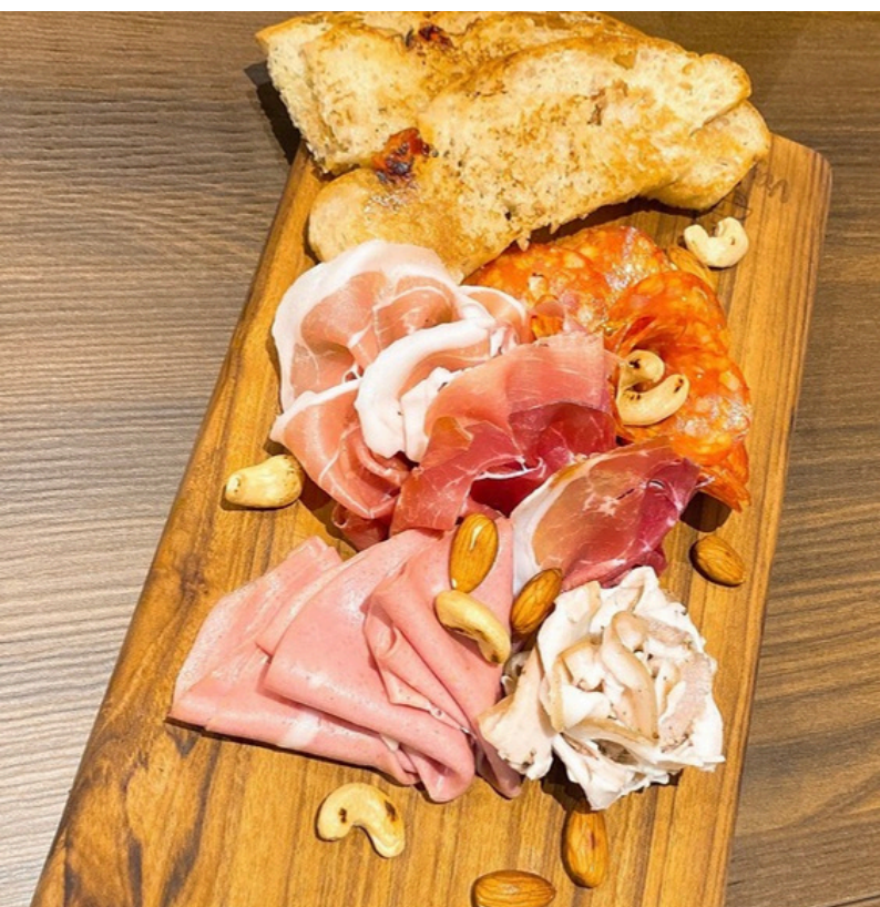
โดลด์ตัดผสม พาร์มาแฮม สเป็ค มอร์ธาเดลลา ซาลามิไส้ชี และ พอร์เซตตา 490