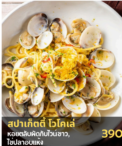
สปาเก็ตตี้ ไวโคเล่