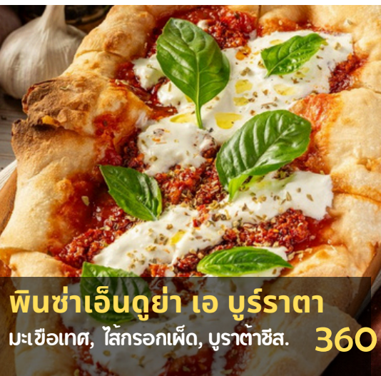
พินซ่าเอ็นดูย่า เอ บูร์ราตา 360 มะเขือเทศ, ไส้กรอกแห้ง, บูราตาชีส.