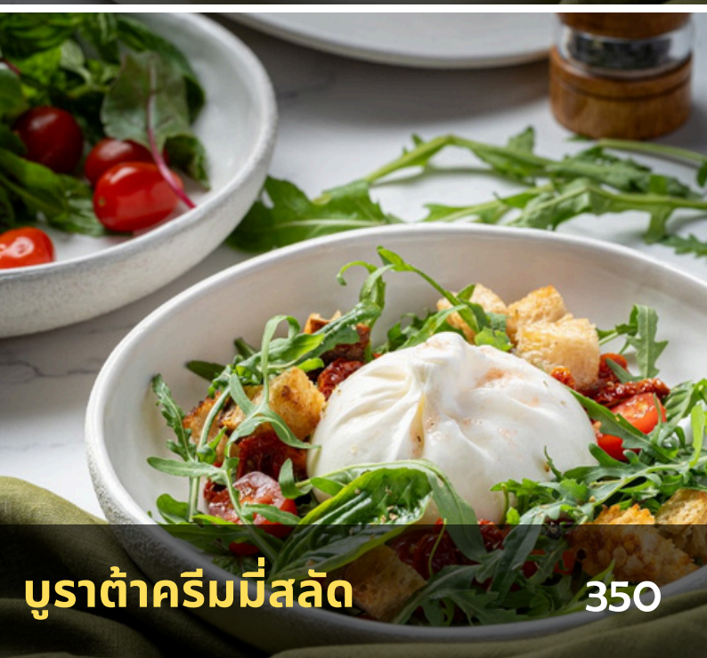
บุราต้าครีมมีสลัด