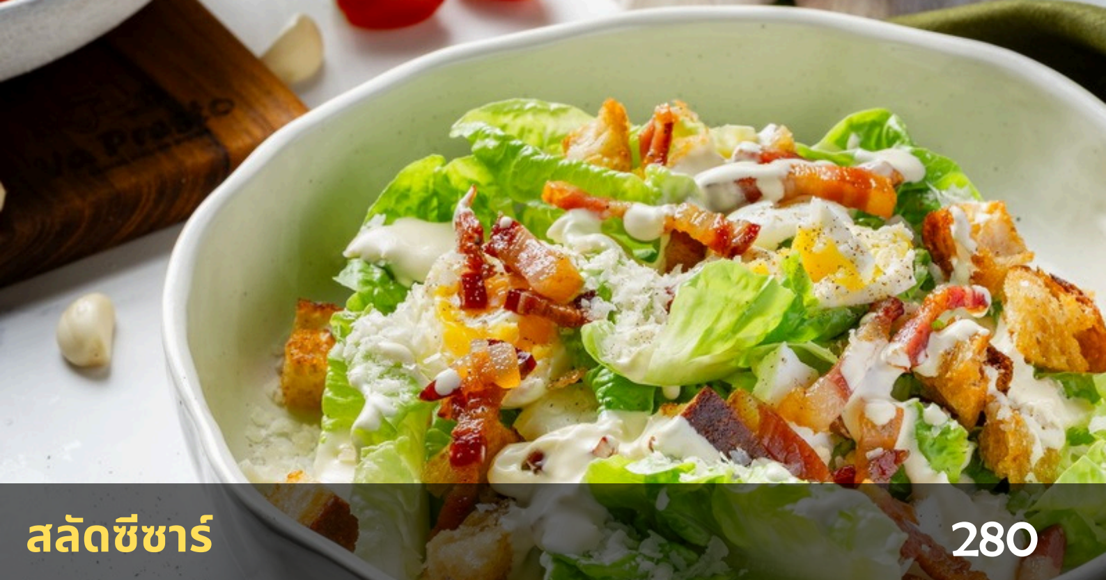
สลัดซีซาร์