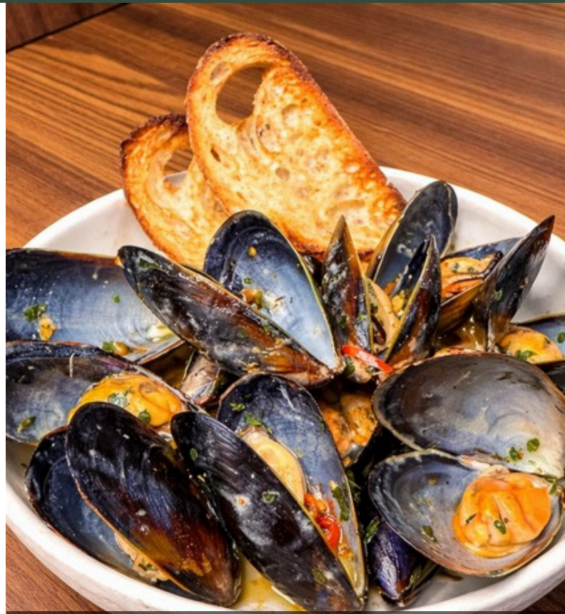
หอยแมลงภู่นึ่ง อบไวน์ขาว