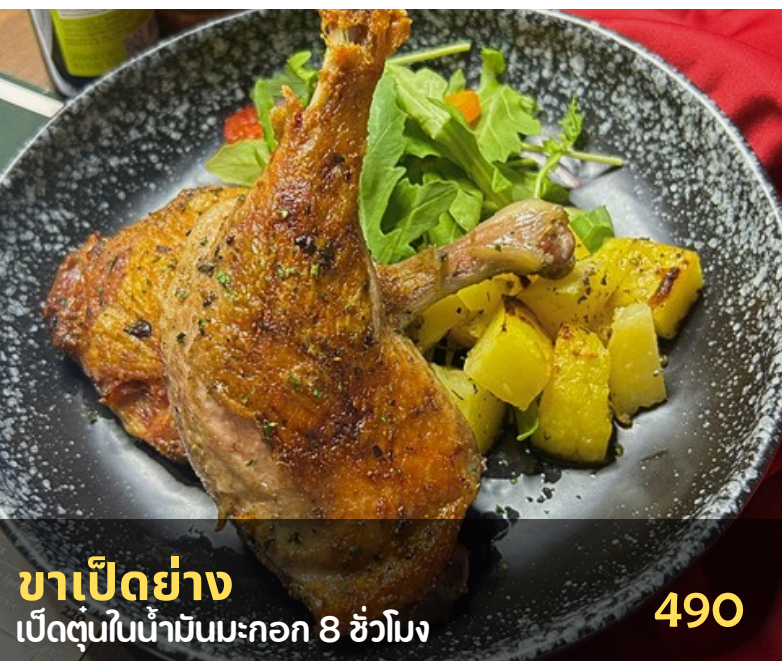
ขาเป็ดย่าง เปิดตุ๋นในน้ำมันมะกอก 8 ชั่วโมง