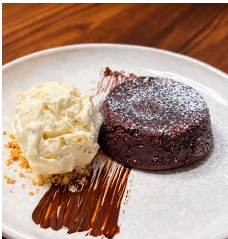
ช็อกโกแลตลาวาเด็ก