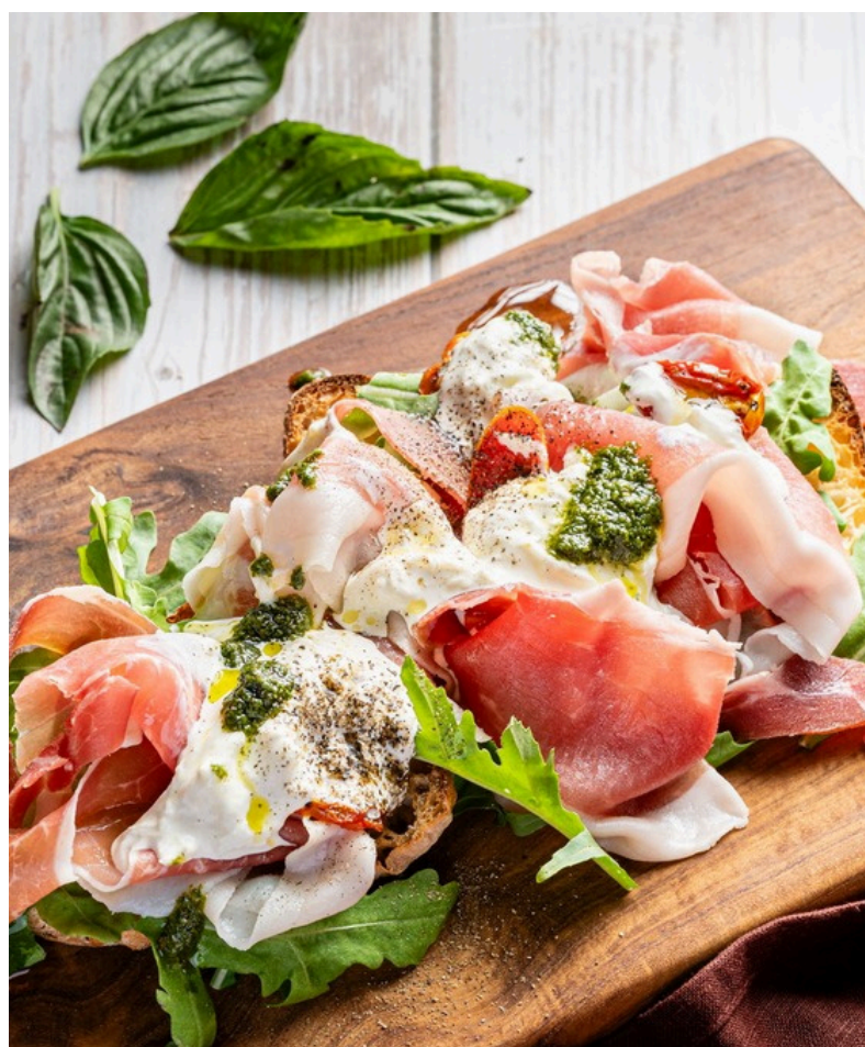
พาร์มาแฮมและ บุร์ราตา