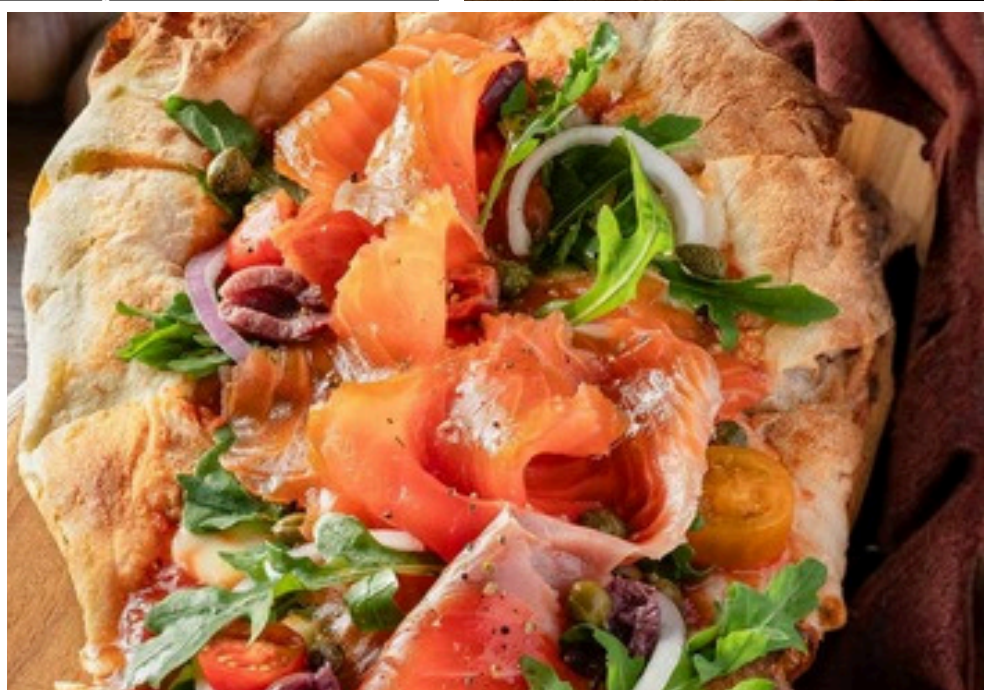
พินซ่าแซลมอนรมควัน 420 มะเขือเทศ มอสซาเรลลาชีส แซลมอนรมควัน