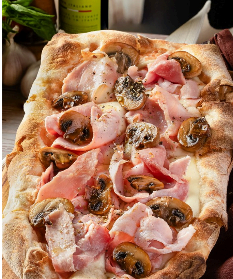
พินซ่าแฮมและเห็ด 360 มะเขือเทศ มอสซาเรลลา แฮมปารีส เห็ด