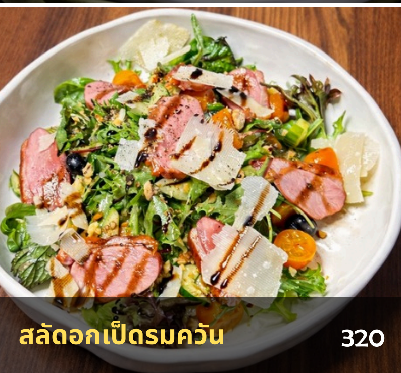
สลัดอกเป็ดรมควัน