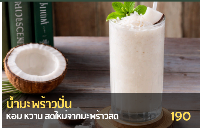
น้ำมะพร้าวปั่น หอมหวาน สดใหม่จากมะพร้าวสด 190