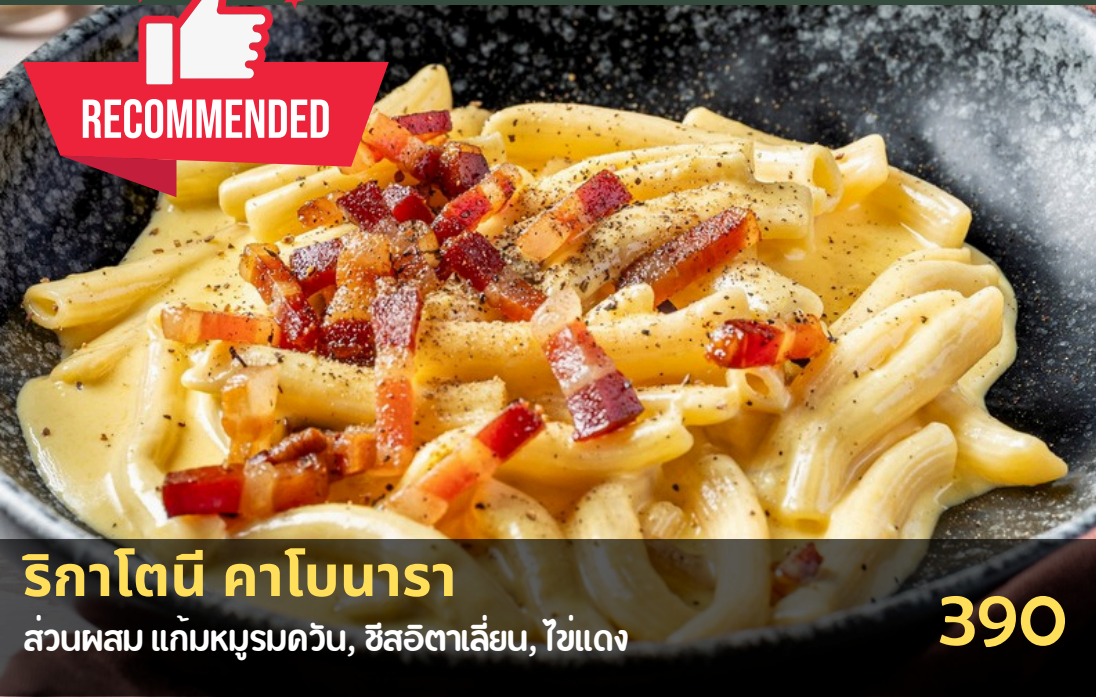
ริกาโตนี คาโบนารา

ส่วนผสม แก้มหมูรมควัน, ซีสอิตาลีเย็น, ไข่แดง