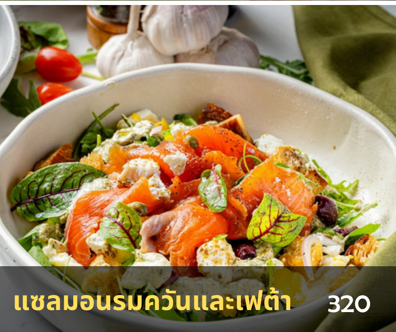
แซลมอนรมควันและเฟต้า