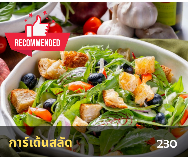
การ์เด็นสลัด