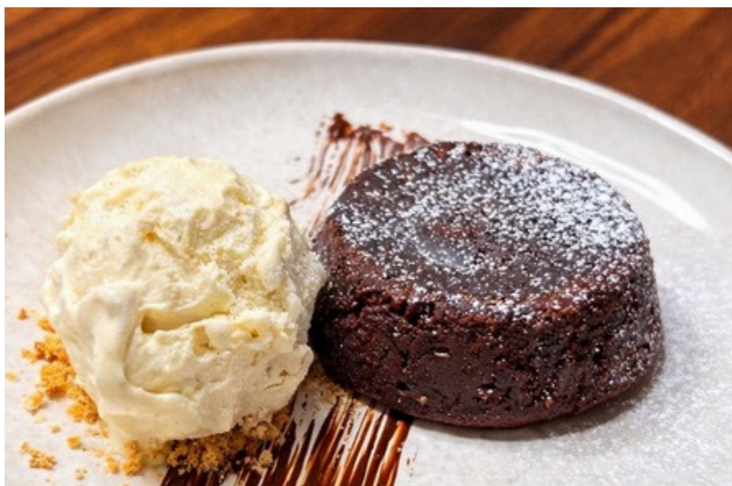
เค้กช็อกโกแลตลาวา 290 เค้กช็อคโกแลตเลิฟพร้อมไอศกรีม