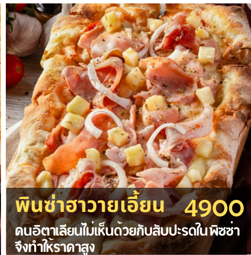
พินซ่าฮาวายเอี้ยน 4900 คนอิตาลีไม่เห็นด้วยกับสับปะรดในพิซซ่า จึงทำให้ราคาสูง