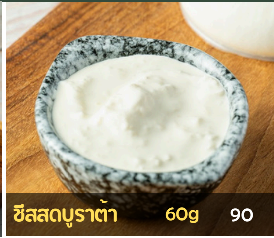
ชีสสดบুরาต้า 60g 90