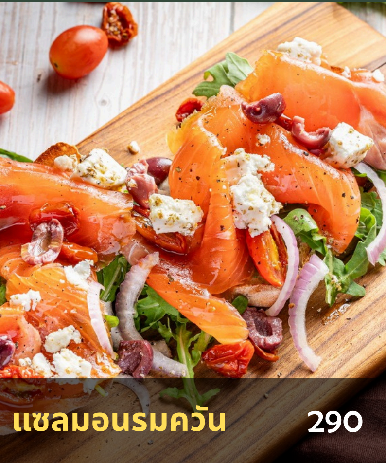
แซลมอนรมควัน