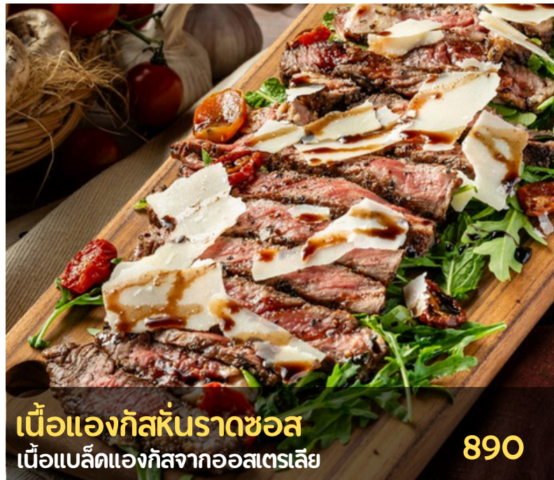
เนื้อแองกัสหันราดซอส เนื้อแบล็ดแองกัสจากออสเตรเลีย