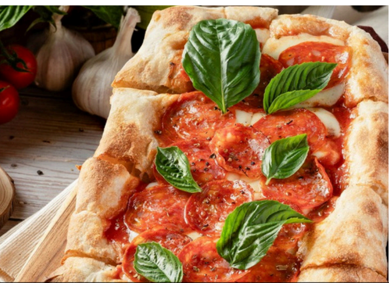
พินซ่าเดียโวลา 390 มะเขือเทศ, มอสซาเรลลาชีส, ไส้กรอกซาลามิ