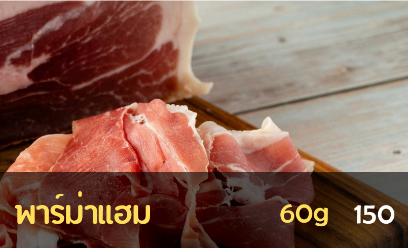
พาร์มาแฮม 60g 150