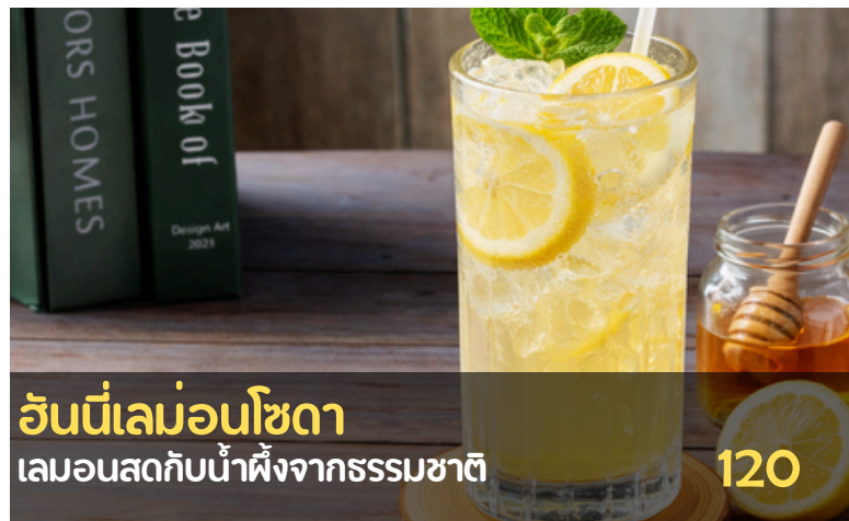
อันนี่เลมอนโซดา เลมอนสดกับน้ำผึ้งจากธรรมชาติ 120