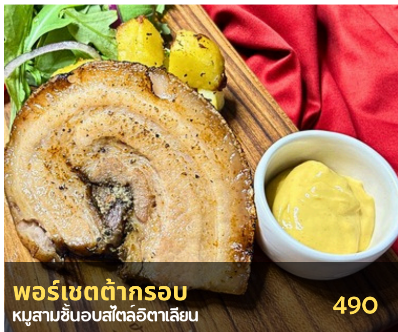
พอร์เซตต้ากรอบ หมูสามชั้นอบสั้ตลั้อิตาเลียน