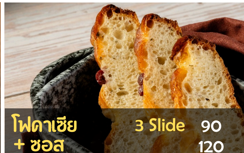
โฟดาเซีย + ซอส 3 Slide 90 120