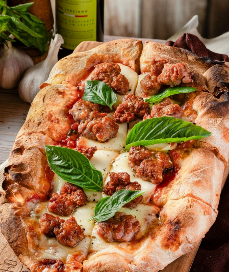
พินซ่าไส้กรอกอิตาลีเลียน 360 มะเขือเทศ มอสซาเรลลาชีส ไส้กรอกอิตาลีเลียน โพรวอลาชีส.