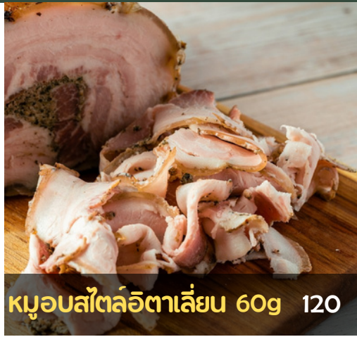
หมูอบสไตลิตาเลียน 60g 120